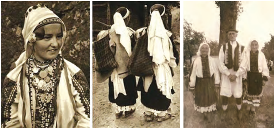
Fig. 1. a) Fată din Chelari (Pădureni) și port tradițional din Bunila (Pădureni); b) Vechi port pădurenesc (Feregi)

Momentul de trecere din viața aceastei în cealaltă era un eveniment care îi privea pe toți locuitorii satului. Un aspect de-