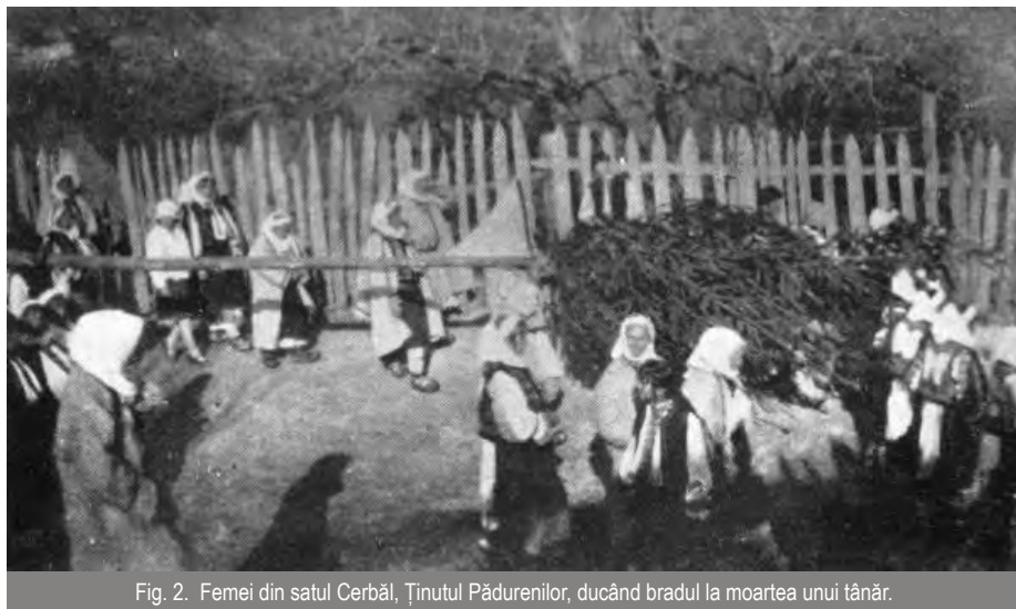
Fig. 2. Femei din satul Cerbăl, Ținutul Pădurenilor, ducând bradul la moartea unui tânăr.

Leșitul în țarină se face cu puțin înainte de recoltarea grâului, când preotul, împreună cu oamenii din sat, iese la „țarină” (terenurile agricole din jurul satului) pentru a sfinți și binecuvânta recoltele. Totul începe cu o slujbă la biserică, la care participă toată suflarea satului, fiind prezenți chiar și cei plecați prin alte părți, apoi se merge spre holdă, în fruntea alaiului cu prapurii, purtați de feciori. La fiecare răscruce se face câte o oprire și se rostesc rugăciuni speciale. Când se ajunge la țarină, tinerele nemăritate culeg fire de grâu abia înspicat, pe care le împletesc într-o fru-